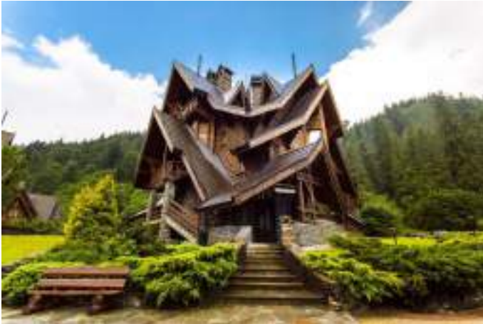
Еко-комплекс "Царинка", Карпати.

Концепція зеленого туризму є дуже привабливою для туристичних підприємств та операторів завдяки зростаючому тиску з боку уряду щодо покращення екологічних показників шляхом впровадження ефективних і відчутних методів управління навколишнім середовищем. Крім того,