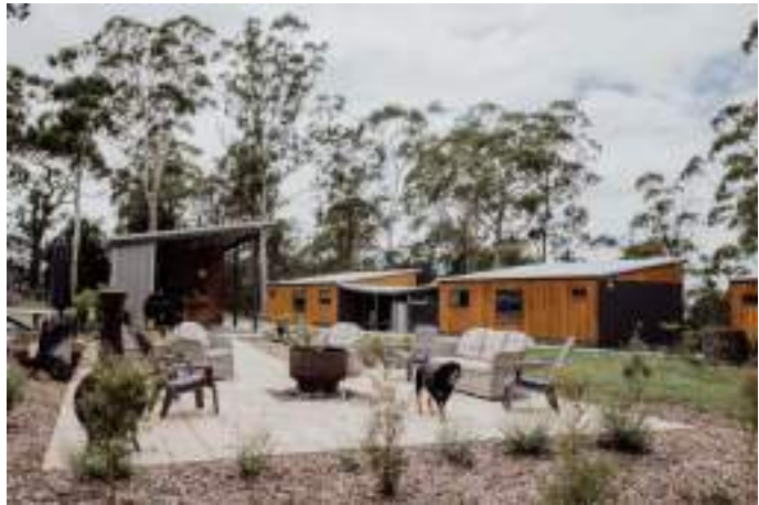
St. Helens, Австралія.

Австралія. Згідно зі опитуваннями, 61% відвідувачів програми Working Holiday Maker в Австралії виїжджали за межі головних міст країни під час свого перебування. Регіональні туристичні об'єкти отримали 26% туристичних прибутків порівняно з 15% у великих та популярних місцевостях.