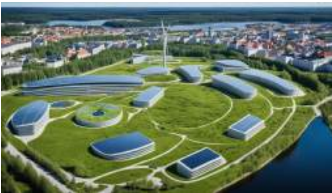
Розвиток "зеленого будівництва" в Естонії.

Сталий розвиток в туристичній галузі є рушійною силою, яка може сприяти соціально-економічному розвитку регіону. Він трансформує