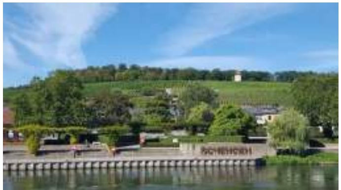
Містечко Шенген у Люксембурзі, де була підписана угода.

Зовсім недавно, 31 березня 2024 року, було скасовано паспортні перевірки на внутрішніх повітряних і морських кордонах між Болгарією та Румунією.