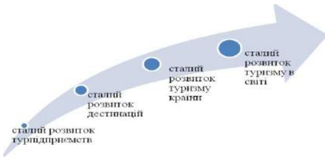
Процес досягнення сталості туризму.

Окрім пом'якшення впливу зміни клімату, зелений туризм має на меті відповісти на нагальний заклик до глобальної екологічної кризи, а також мінімізувати наслідки багатьох екологічних проблем, включаючи забруднення, викиди парникових газів та CO 2 , які в цьому сенсі є критично важли-