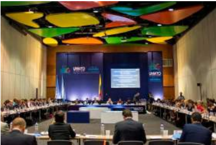
Асамблея ВТО.

рівництво для всіх тих, хто в державному та приватному секторах має зобов'язання, відповідальність, обов'язки та права щодо питань, які розглядаються в Кодексі.