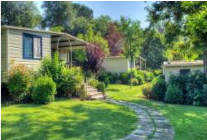
Кемпінг Ailly-sur-Somme, Франція.

Сьогодні зелений туризм розвивається досить швидко і приваблює