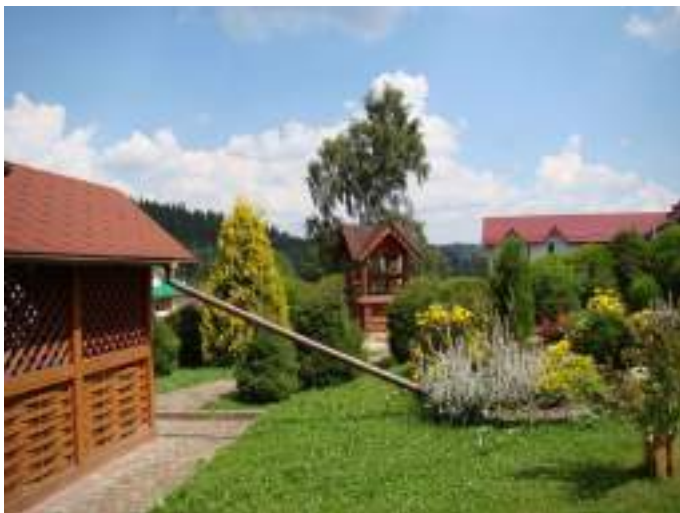
Агрооселі Дрогобиччини.

ціальний вплив на промислові потреби. Зелений туризм, таким чином, сприяє мінімальному негативному впливу на навколишнє середовище та його змінам.