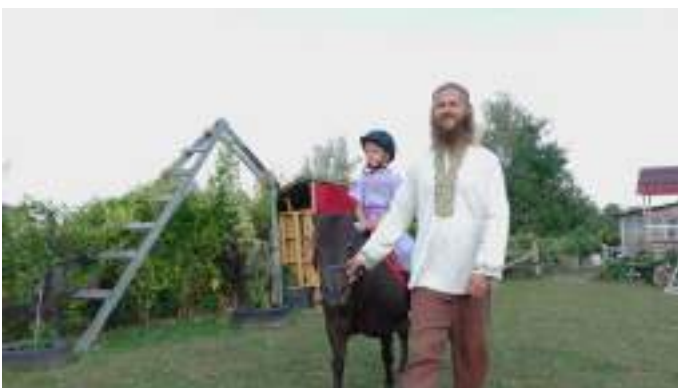
Екосадиба у Вістовій, Прикарпаття.

Природні компоненти, такі як національні парки, ліси, струмки та інші, продовжують залишатися популярними туристичними об'єктами. Зі зростанням туризму в природних регіонах зростає і потреба у фахівцях з туризму для обслуговування цих відвідувачів. Еко-відвідувачі – це туристи, які прагнуть отримати досвід пізнання природи, діючи при цьому в екологічно та соціокультурно сталий спосіб.