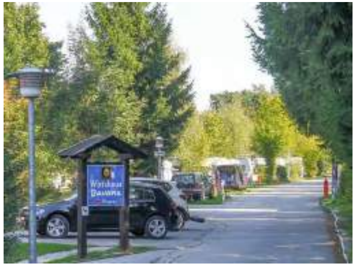
Кемпінг-парк Bavaria Kur-Sport Campingpark, Німеччина. Джерело: https://www.familienfreundliche-campingplaetze.de/campingplatz/bavaria_kursport_campingpark/

Якщо говорити про абсолютні показники, то державами-членами з найбільшою кількістю ліжко-місць у сільській місцевості у 2021 році були Франція, Італія, Німеччина, Іспанія, Греція, Австрія та Хорватія, причому більшість з них (за винятком Італії та Іспанії) також мали більше ліжко-місць у сільській місцевості, ніж у містах, містечках чи передмістях. Це також держави-члени з найбільшою кількістю ночівель, проведених туристами в об'єктах розміщення в сільській місцевості.