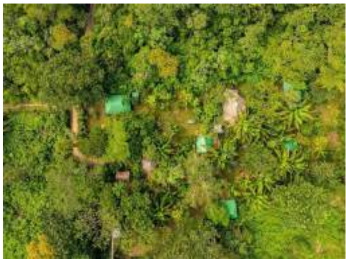
Tronco Tambopata Adventure, кемпінг, Пуерто-Мальдонадо, Перу. Джерело: https://www.trivago.co.uk/en-GB/oar/camping-site-tronco-tambopata-adventure-puerto-maldonado?search=100-28935172

Перу. Inkaterra Reserva Amazónica – це розкішний еко-