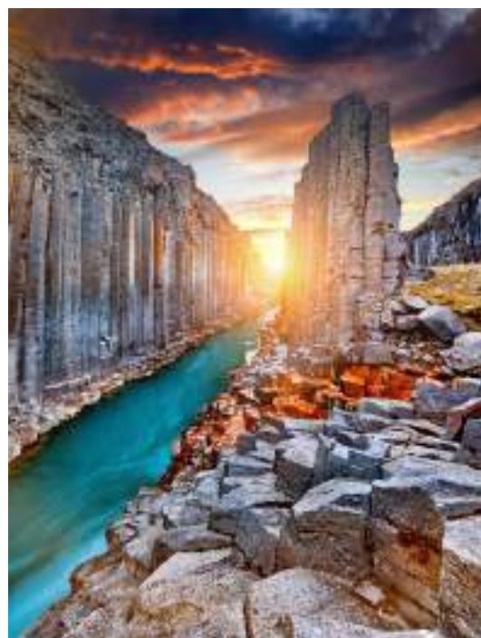
Iceland Ring Road, кільцева дорога в Ісландії.