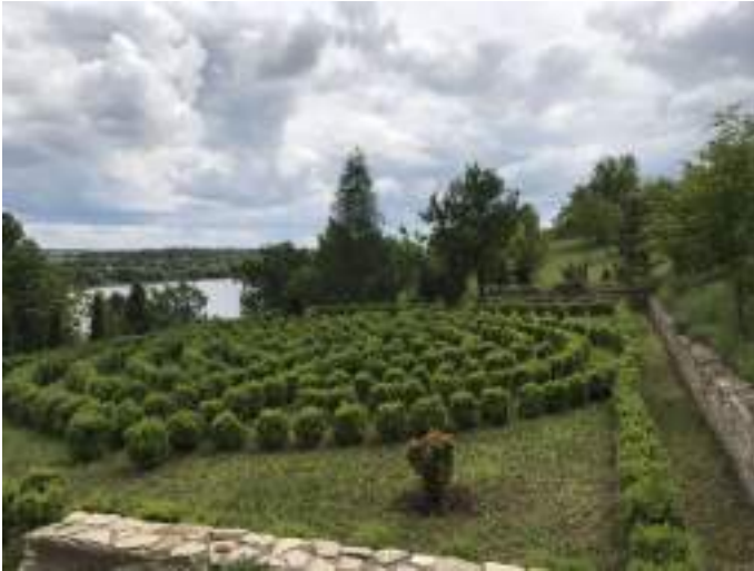
Приватний дендропарк в Хотині.

Деякі з трендів в галузі туризму, які суттєво сприяють запобіганню та зменшенню забруднення, включають: використання вимикачів з датчиком руху, встановлення сміттєвих баків, використання продуктів і матеріалів з переробленого вмісту, повторне використання матеріалів,