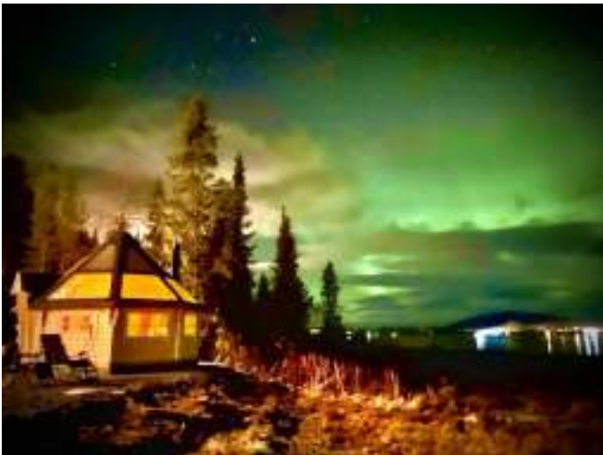
Бунгало Northern Lights Huts - Paradise Lapland, Лапландія, Швеція.

Розглянемо деякі програми та стратегії щодо розвитку зеленого туризму у країн-лідерів цієї індустрії.