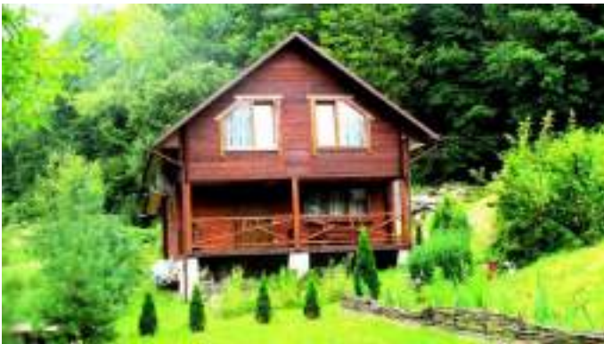
Садина "Заманушка", Винжичина.

Зелений туризм визначається як екологічно чиста туристична діяльність. У широкому розумінні, зелений туризм означає туристичну діяльність, спрямовану на збереження довкілля, або надання екологічно чистих туристичних послуг.