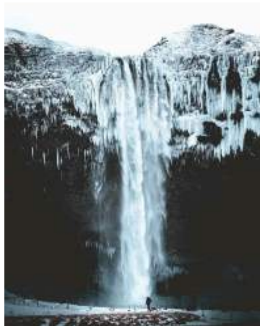
Seljalandsfoss waterfall in winter by Norris Niman. Джерело: https://hiddeniceland.is/iceland-must-see-6-day-private-tour-winter-itinerary

Індустрія подорожей і туризму особливо вразлива до зовнішніх ризиків, таких як геополітика, стихійні лиха, техногенні катастрофи та хвороби. Захист і збереження природних і культурних цінностей мають вирішальне значення для доходу, зайнятості та майбутніх поколінь. Багато туристичних об'єктів залежать від багатства дикої природи, флори і фауни як ключової частини їхньої туристичної пропозиції. Туристичний бізнес підтримує