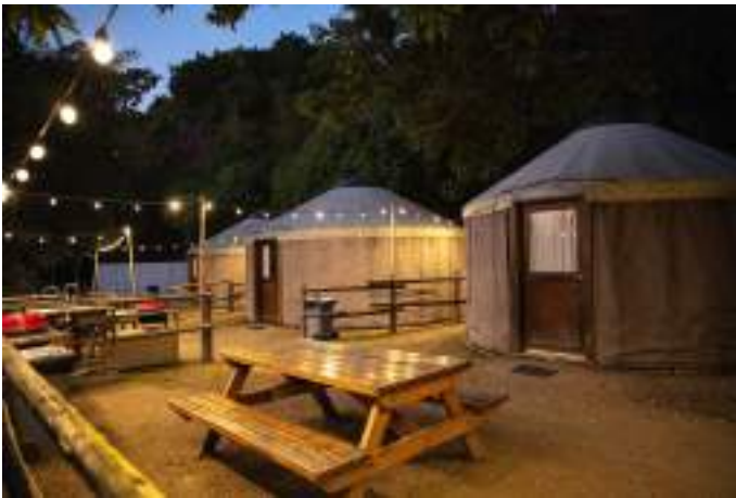
Гоемпінг Sai Wan, Гонконг.

Багато латиноамериканських країн давно відомі як лідери екологічного туризму завдяки еко-оселям, які не суперечать природному середовищу регіону. Зокрема, екологічні оселі в Перу стали вирішальним елементом привабливості країни, дозволяючи споживачам відпочити та відчути природу з мінімальним впливом на навколишнє середовище.