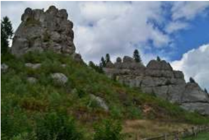
Село Урич, фортеця-град Тустань, Львівська обл., що увійшло до переліку найкращих туристичних сіл за версією ООН.

Програма «Найкращі туристичні села за версією ВОР» відзначає видатні сільські туристичні дестинації з акредитованими культурними та природними цінностями, прихильністю до збереження цінностей громади та чіткою прихильністю до інновацій та сталого розвитку в економічному, соціальному та екологічному аспектах.